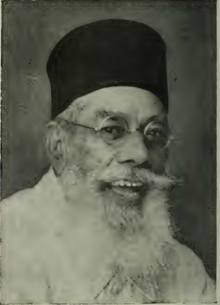
धर्मवीर डॉ. बाळकृष्ण शिवराम मुंजे